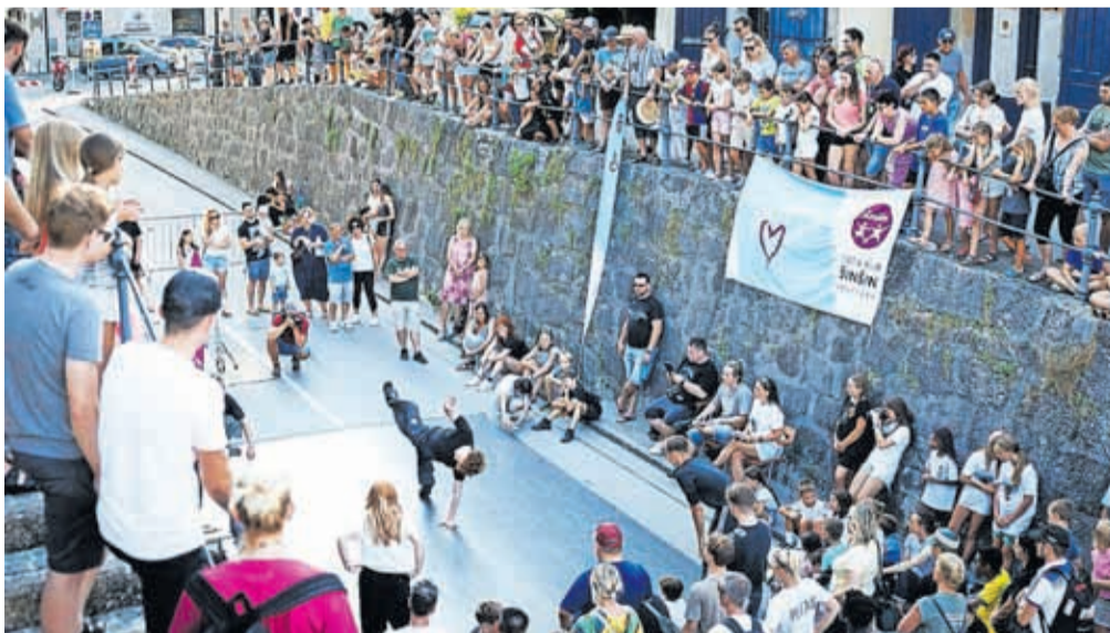
Tudi ob začetku letošnjega poletja v Kamniku pripravljajo pester program.

V nedeljo, 21. junija, ob isti uri bo sledil nastop Mestne godbe Kamnik pod vodstvom Karima Zajca, ob njej pa članice Društva kamni-