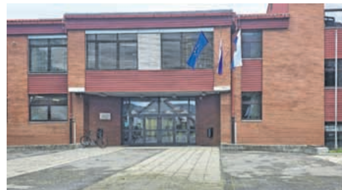
Voda je vdrla tudi v prostore Osnovne šole Marije Vere.

Močan veter je povzročil tudi poškodbe dreves v gozdovih, kar zaradi nevarnosti podlubnikov zahteva nujno sanacijo. Zavod za gozdove Slovenije zato poziva lastnike gozdov, naj sami pregledajo svoje parcele in pred začetkom del obvestijo revirnega gozdarja ter se z njim posvetujejo, pri čemer lahko sanacijo začnejo že pred izdajo uradne odločbe. Obenem ZGS opozarja obiskovalce, naj se zaradi padajočih vej izogibajo poškodovanim območjem in s parkiranimi vozili ne ovirajo spravlja lesa.