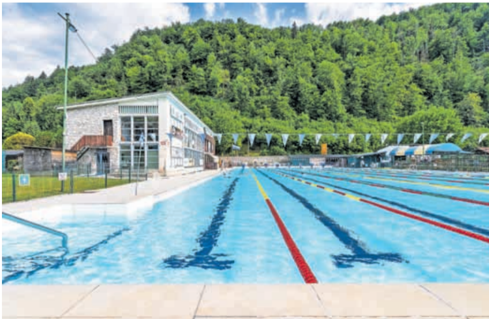
Kamniški bazen je odprt vse do konca avgusta.

Pred začetkom sezone je občina zaključila prenovo bazenskih sanitarij. Prenovljene so bile ženske in moške sanitarije, urejene so bile sodobne sanitarije za invalide, dodatno pa so uredili tudi kabino s previjalnico in opremo za otroke. Posodobili so inštalacije, prezračevanje, razsvetljava, okna in vrata, vgrajeno pa je bilo talno gretje. Vrednost investicije je znašala dobrih sto tisoč