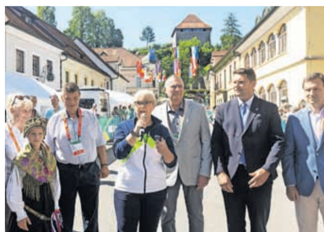
Zbrane je v nedeljo nagovorila tudi predsednica republike Nataša Pirc Musar.

vladale zelo slabe vremenske razmere, marsikdo ni mogel verjeti, kaj zmoremo in kaj smo naredili za tekmovalce. Pri nas je namreč na prvem mestu vedno varnost, šele nato vse drugo.«