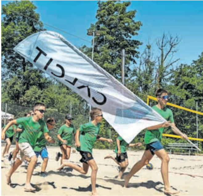
Utrinek z lanskoletnega Calcitovega tabora