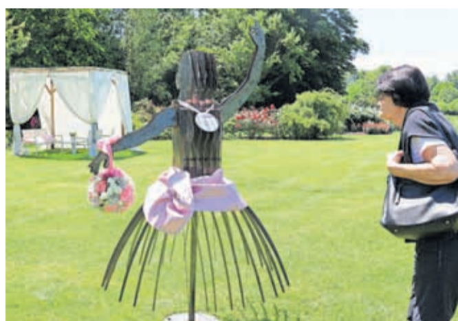
Ena od gospodičen v parku, Klementina

Poseben del letošnje sezonske zgodbe Obrazi vrtnic pa je deset skrivnostnih t. i. gospodičen, poimenovanih po sortah vrtnic, ki obiskovalca