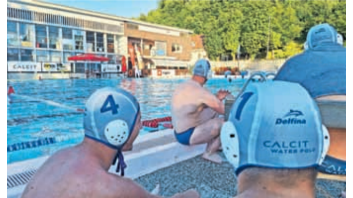
Calcitovce po zadnji tekmi sezone čaka prijetno druženje Pod skalco.