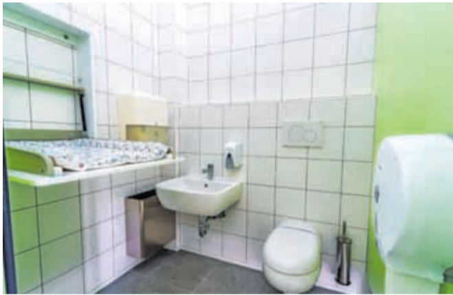
V renovljenih sanitarijah so uredili tudi previjalnico.

evrov. Vrednost kompleksu dodaja tudi sončna elektrarna, nameščena leta 2025, s katero občina sledi ciljem trajnostnega razvoja in energetske učinkovitosti.