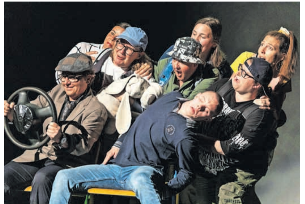
Iz predstave Kit na plaži, učiteljska skupina Verine zvezdice iz OŠ Marije Vere na odru Doma kulture Kamnik

Ta sezona je bila še posebej zanimiva, ker smo izpeljali projekt Kdo se boji?, kjer smo skupaj s kamniško knjižnico in OŠ 27. julij na vseh centralnih kamniških šolah izvajali programe, namenjene slovenski in albansko govoreči skupnosti. Projekt je podprlo Ministrstvo za kulturo RS. Učenci OŠ 27. ju-