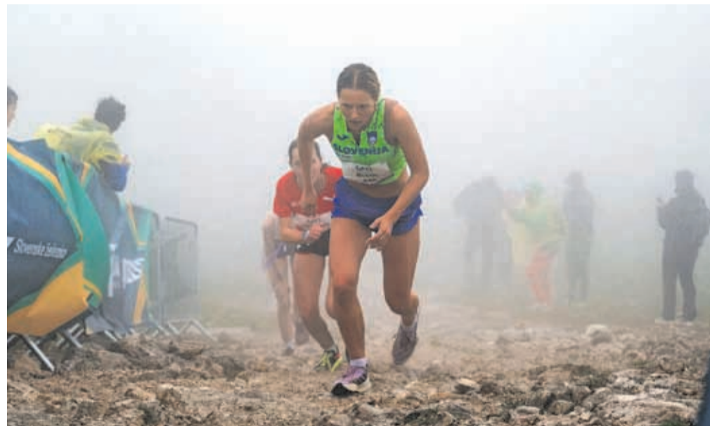
Čeprav je v petek na Veliki planini vladalo slabo vreme, je organizatorjem uspelo izpeljati tekmovanje in poskrbeti za varnost vseh udeležencev.