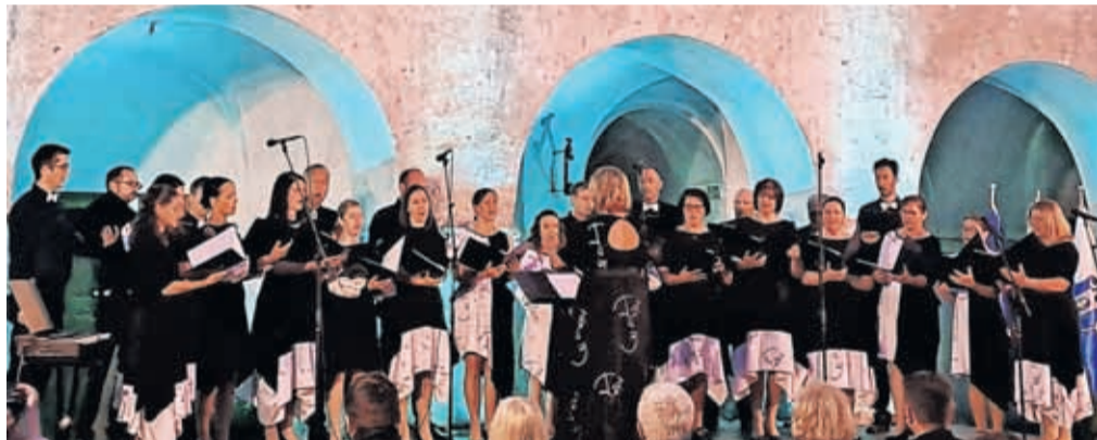
Trije kamniški zbori (na fotografiji MePZ Odmev) so nastopili na koncertu z domoljubno tematiko.