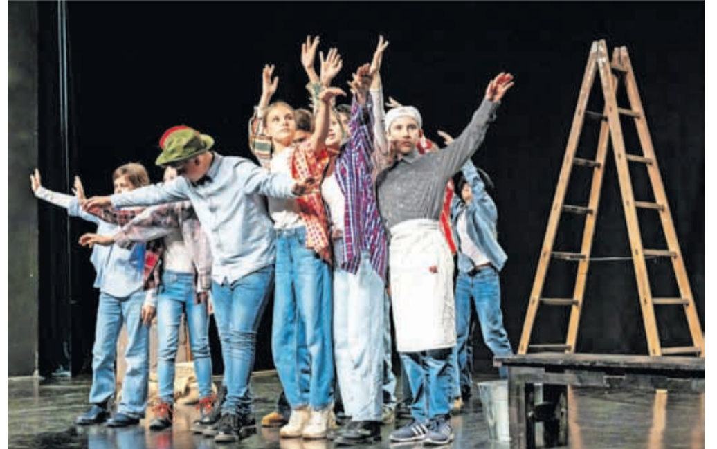
Eden od prizorov s srečanja otroških gledaliških skupin Slovenije, ki je potekalo v kamniškem domu kulture.

čila predstave, ki so raziskovalne, inovativne in najbolj izrazito uporabljajo lutkovni jezik. Predstave, kjer lutka ni nadomestek igralca, ampak je domišljen izraz ideje ali vsebine,« pa je o izboru