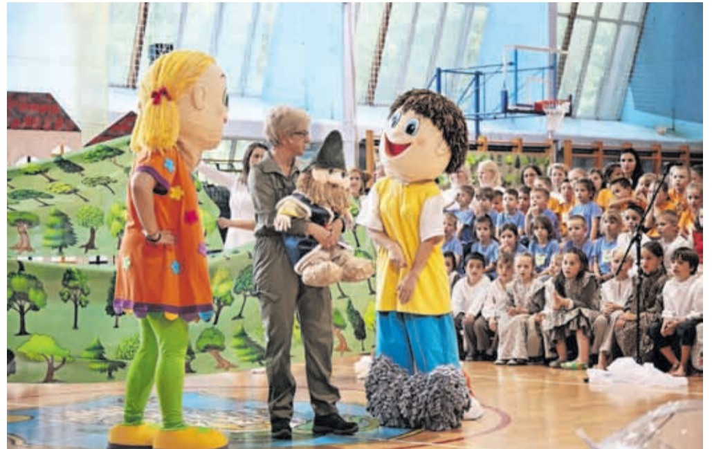
Skozi zgodbo o Sofiji, Vidu in kužku Tačku so približali skrb za naravo.