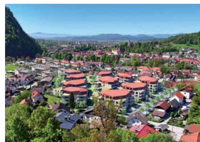
Nova soseska bo dopolnila podobo kraja in ohranila razgled na staro mestno jedro.

Projekt iz obdobja premišljenega in natančnega načrtovanja vstopa v naslednje obdobje priprave na izvedbo. Gradnja se bo začela takoj po potrditvi novega OPPN in pridobitvi gradbenega dovoljenja, trajala pa bo predvidoma dve leti. Investitor pro-