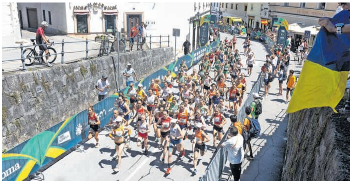
Kamnik z okolico je predstavljal odlično kuliso za evropsko prvenstvo.