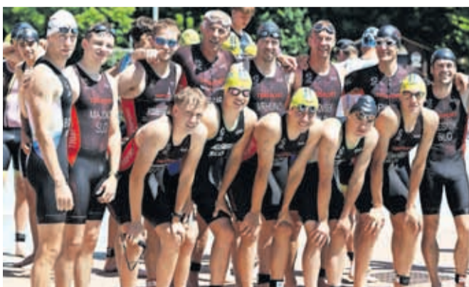
Številna kamniška ekipa je odlično nastopila na Kodeljevem.