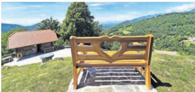
Klopca ljubezni na Gori sv. Miklavž

Turistično društvo Gora sv. Miklavž se ob tej priložnosti zahvaljuje Zavarovalnici Generali. Z obiskovanjem Klopce ljubezni namreč zbirajo sredstva za pomoč otrokom in družinam v stiski. Za vsak zabeležen obisk Generali nameni sredstva v dobrodelni sklad.