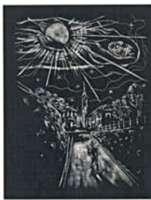
Miha Maleš: Pod oknom, 1935, gravura. Prizor iz Prešernove pesmi je postavljen v Samčev predor v Kamniku. Hrani Galerija Miha Maleš Kamnik.