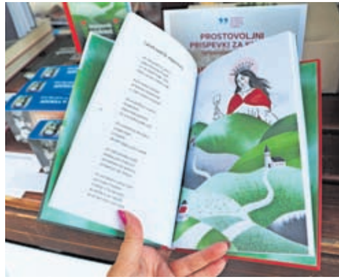
Knjiga na novo odkriva Maistrovo poezijo, ilustracije pa ji dodajo novo razsežnost skozi simbolno govornico podob in barv.