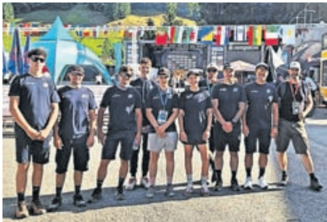
Na evropskem prvenstvu v Champéryju

»Z reprezentanco sem se udeležil evropskega prvenstva v Champéryju. Bilo nas je zelo veliko prijavljenih, zato smo imeli zelo malo treninga, kar mi pa ni ustrezalo, saj sem bil na progi prvič. Proga je zelo strma in hitra. Zaradi veliko poškodb tekmovalcev in reševanja s helikopterji so bile v soboto na