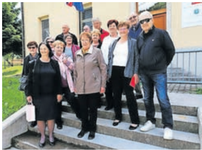
Nekdanji sošolci v Zgornjem Tuhinju