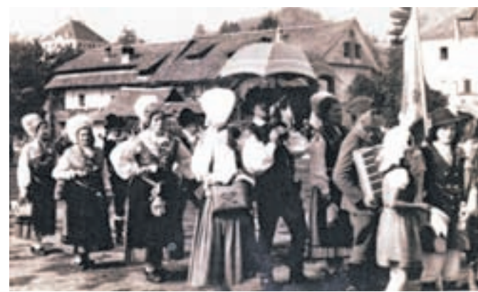
Pred sprevedom narodnih noš leta 1966 (harmonikar, ki stoji za zastavo, ima partizansko uniformo)

policalih so se bohotila korita z rožami, vsepovsod so plapolale zastave. Izložbena okna trgovskih lokalov so krasili eksponati, ki jih je v ta namen posodil kamniški muzej. Dogodek se je začel ob 11. uri s promenadnim koncertom godbe na pihala na Titovem trgu, povorka s tremi konjeniki na čelu pa je na pot krenila točno ob 14. uri izpred Osnovne šole Toma Brejca.