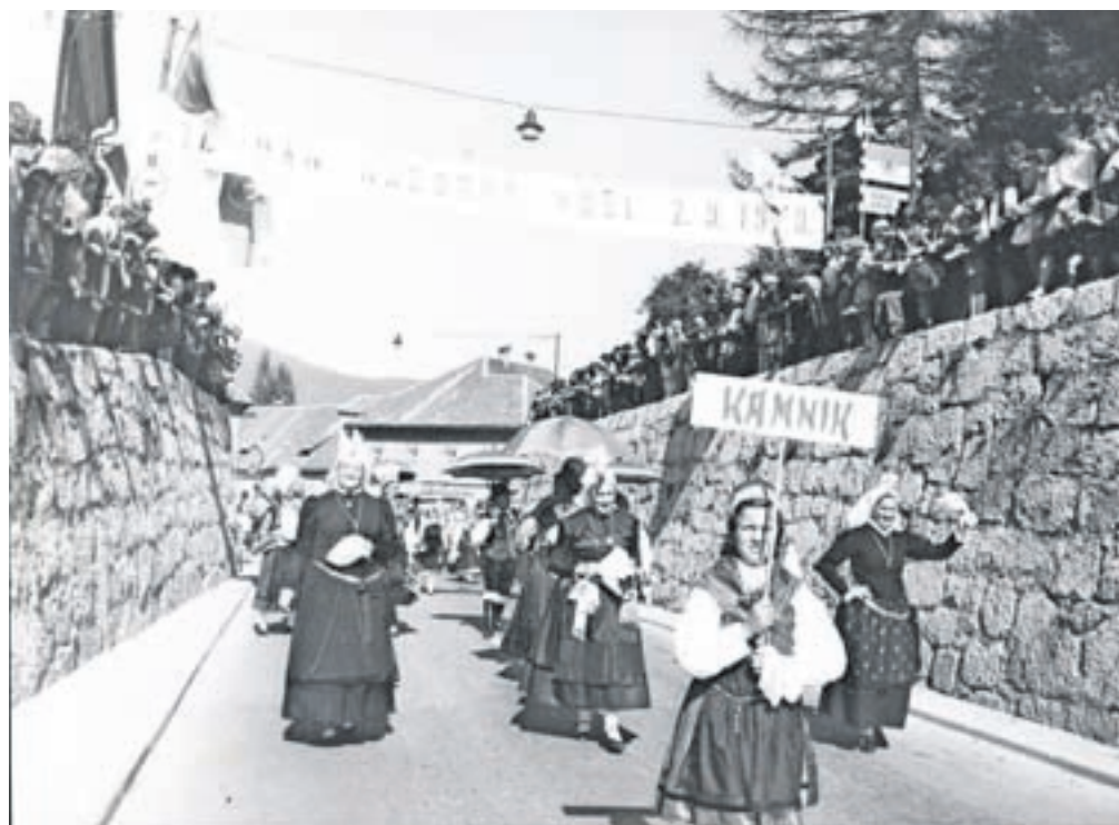
Kamničani na 6. Dnevu narodnih noš 2. septembra 1973 / HRANI MEDOČINSKI MUZEJ KAMNIK.

Že od nekdanj so ljudje z oblačili in kostumi izražali pripadnost določeni skupnosti – pokrajinsko, tudi krajevno, predvsem pa stanovsko. Kasneje so se v slavnostna oblačila odeli le ob posebnih priložnostih. Posebej dolgo so svoje običaje ohranjali v Podgorju. »Kdor pozna Kamnik, ve, kdo so Podgorčani. Podgorčani so posebne vrste ljudje, ki imajo svoje šege in navede, svojo nošo in svoje križe in težave.« (Suchy, 1928) V okviru turističnega tedna se je leta 1963 Prosvetno društvo skupaj z vaščani Podgorja odločilo širšemu občinstvu predstaviti skoraj pozabljene podeželske »svatbene« običaje – zdaj že – naših prapradedov. Leseni