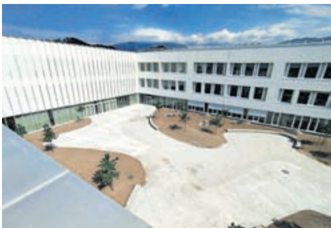
Šola v obliki črke U je sestavljena iz treh lamel.