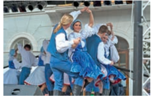
Slovaška – Folklorny súbor Skaličan, Skalica