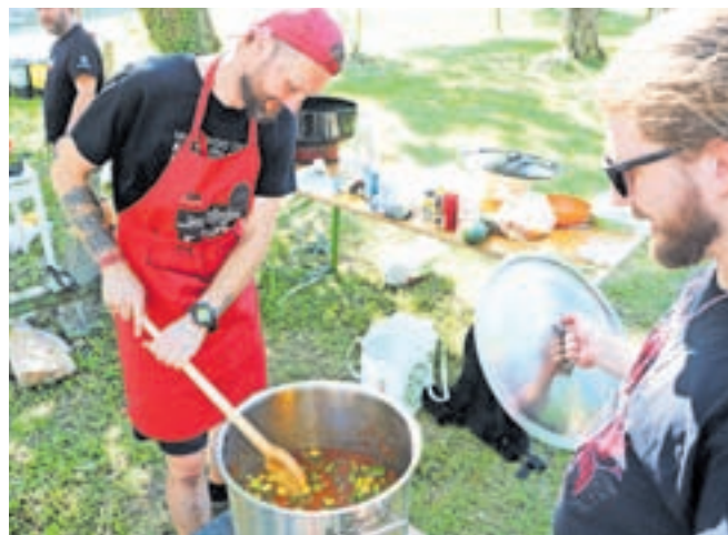
Izmenjevalnica oblačil je tokrat postregla tudi z zelenjavno juho.