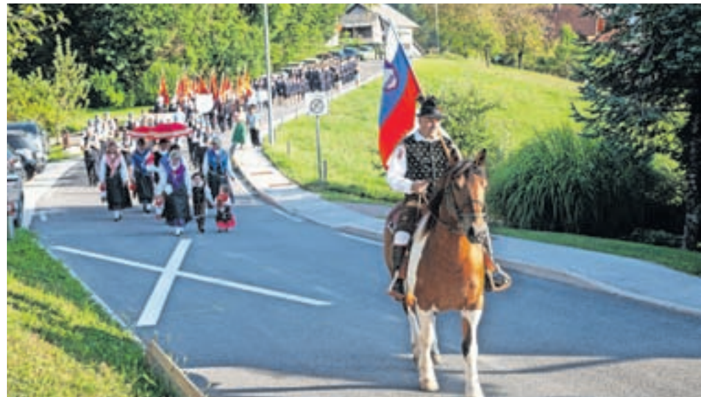
Gasilska parada ob odprtju prizidka