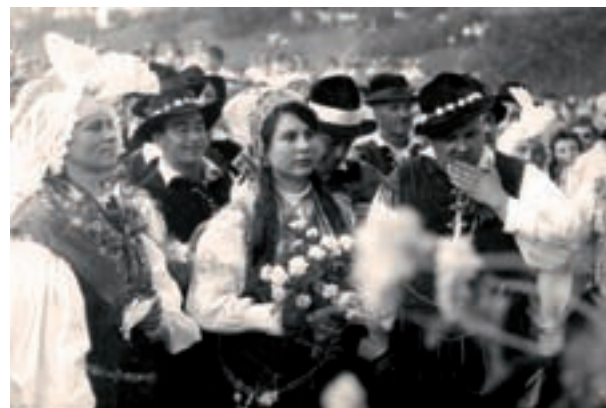
Najstarejša fotografija vseh povork

V Kamniku, čudovitem mestecu z bogato zgodovino in edinstveno kulturno dediščino, že več kot pol stoletja potekajo Dnevi narodnih noš in oblačilne dediščine, ki vsako leto znova oživijo bogato tradicijo oblačnja in folklorne dediščine. Ta etnološka prireditev, ki je postala mednarodno priznana kot festival pod okriljem CIOFF (Mednarodnega sveta za organizacijo folklornih festivalov), zvesto sledi svojemu poslanstvu ohranjanja, spodbujanja in širjenja tradicionalne kulture in folklorne.