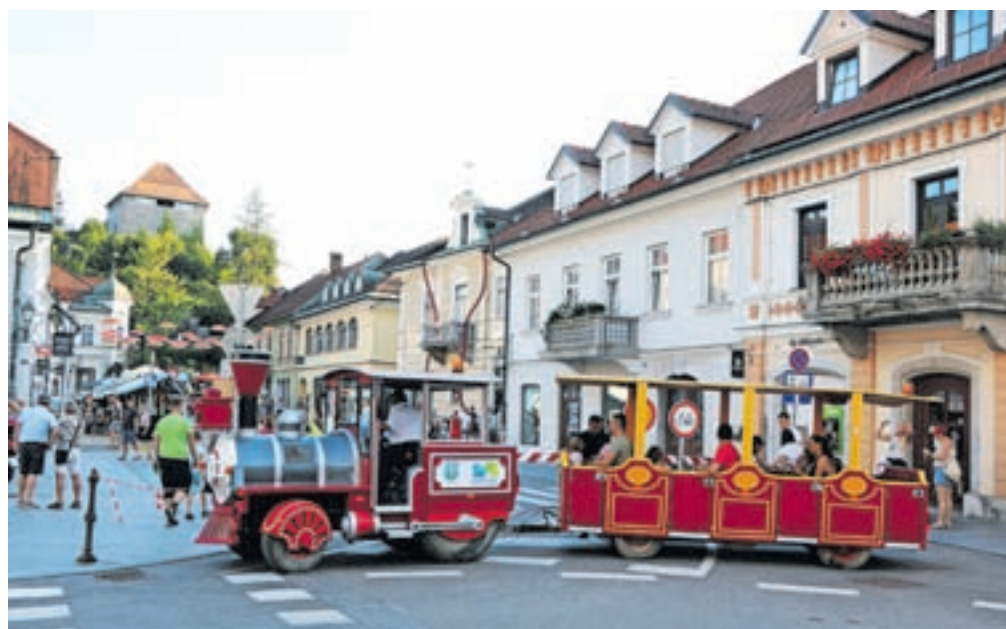
Novost letošnjega Kamfesta, ki so jo izjemno dobro sprejeli predvsem najmlajši obiskovalci, je bil cestni vlakec, ki je vse festivalske dni povezoval nekaj glavnih lokacij.

Kamfest je znan po tem, da ima dobro koncertno ponudbo. Festival sta na Mestnem odru odprli zasedbi Ana Papedan in Počeni škafi, zak-