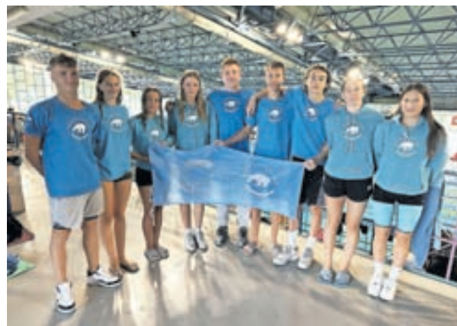
Plavalci kamniškega kluba na prvenstvu v Kranju