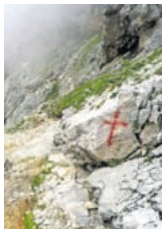
Delo neznanca na poti med Repovim kotom in Srebrnim sedlom

Kot nam je povedal, je tovrstni vandalizem delo iste osebe. »Kot kaže, gre za nekoga, ki ve, kdaj se takšnega početa lahko loti, da ostane neopažen. A kdo ve, morda mu pa vendarle pridemo na sled,«