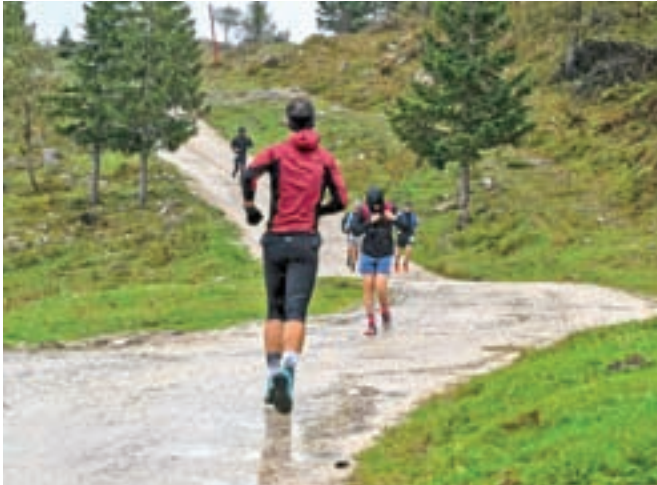
Tekači na prvi izvedbi Traila Velika planina

Program s pozdravnimi nagovori in predstavitvijo trase se bo začel ob 10.30, na proge pa se bodo tekači podali ob 11. uri.