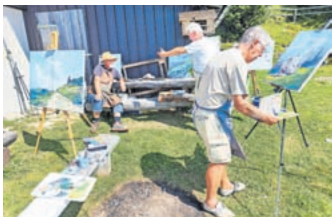
Ob tako lepem vremenu in okolju so imeli slikarji veliko navdihov ter polne roke dela in barv...