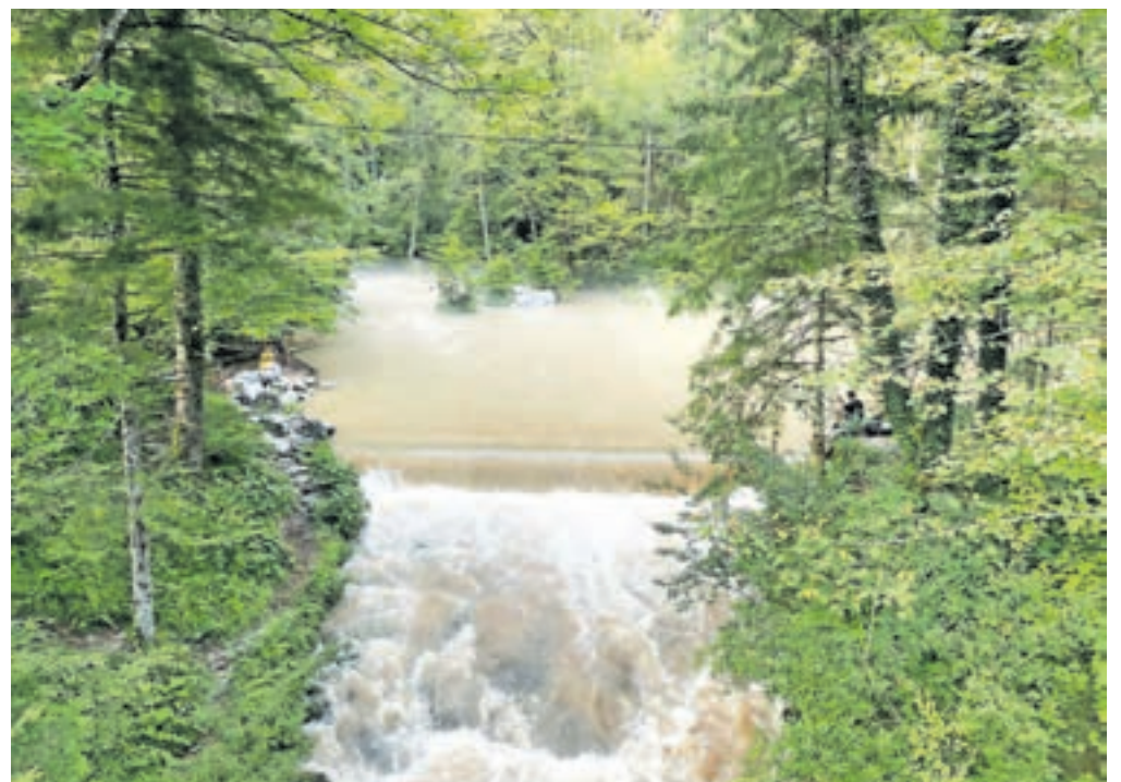
Izvir Kamniške Bistrice

co zapolnjene in zaprte rove. Morda je prišlo v podzemlju tudi do večjih podorov, ki so blokirali spodnje rove in vodo preusmerili v fosilne rove. Tudi na izviru Kamniške Bistrice se je pojavila neobičajno kalna voda. Ker se kalnost ni zmanjšala v naslednjih dneh, je Jamarski klub Kamnik 22. julija vzorčil izvirsko vodo za mikrobiološke analize in izme-