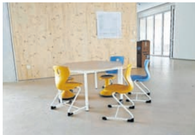
Notranji prostori šole