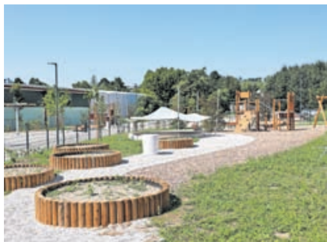
Zunanje površine / FOTO: OBČINA KAMNIK

mreč načrtujejo rušitev starega, potresno nevarnega šolskega poslopja, nato pa ureditev zunanjih površin med novo šolo in Osnovno šolo Toma Brejca, kjer načrtujejo športni park z igrišči, tekalno progo, poligona za skok v daljino ter ureditev prostora za druženje in pouk na prostem. Po investiciji, ki bo znašala dobra dva milijona evrov, bo sledila še gradnja nove športne dvorane.