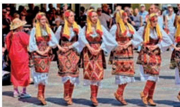
Severna Makedonija – KUD Kočo Racin, Skopje