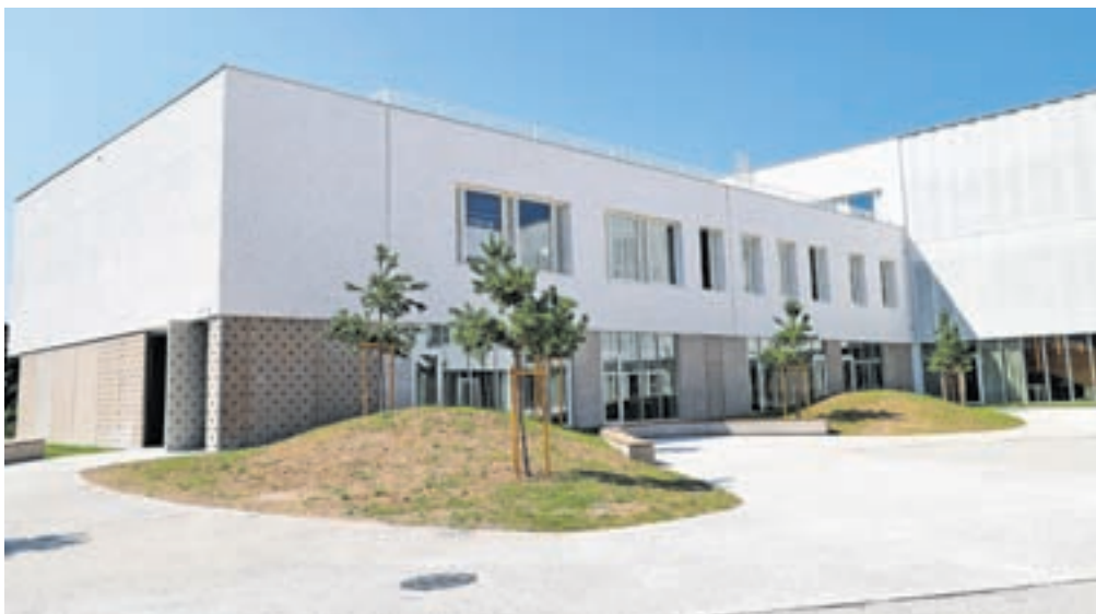
Sodobna zgradba postavlja nove standarde v slovenskem šolstvu.

Objekt je popolnoma prilagojen sodobnim pedagoškim metodam in se, kot pravijo v Kamniku, uvršča med