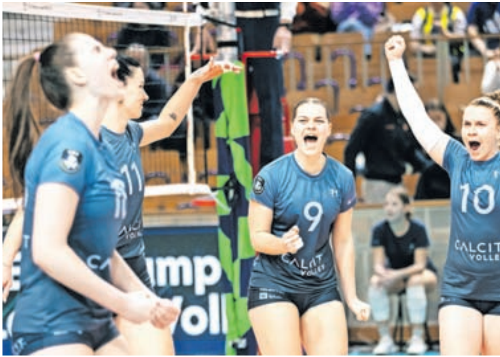
Kamniške odbojkarice čakajo na prve tekme

»Čeprav je zame kot trenerja in tudi za klub idealno, da imamo praktično od prvega dne priprav na voljo vse igralk, bi si po drugi strani želel, da bi imeli svoje igralk v reprezentanci. Ampak kakor koli že, najpomembnejše je, da igralk že od prvega treninga naprej kažejo isto vnemo kot čez celotno lansko sezono. Upam, da bomo imeli še naprej dobro vzdušje, ki nas je krasilo že lani, in da se bomo dobro pripravili na začetek prvenstva,« je po prvih treningih povedal Najdič, ki bo drugo sezono vodil calcitovke. Tako kot lani bodo tudi letos igrale v štirih različnih tekmovanjih. Ob obeh domačih, državnem prvenstvu in pokalu, bodo še drugič zaporedoma igrale v ligi prvakinj, v srednjeevropski ligi pa bodo, tako kot v domačem prvenstvu, branile lansko prvo mesto. »Šele v tem te-