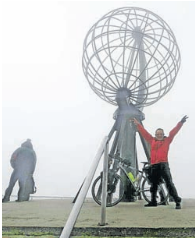
Na Nordkappu

Čprav smo se z njim pogovarjali le nekaj dni po vrnitvi v domači Kamnik, pa je že poln novih idej. Kot pravi, ga zagotovo še čaka kakšna podobna kolesarska avantura, morda tudi na kakšni izmed preostalih celin, saj bi rad doživel tudi to izkušnjo. Razmišlja pa tudi o potovanju v Indijo, kjer pa bi se bolj kot kolesarstvu rad podrobneje posvetil jogi in ajurvedi.